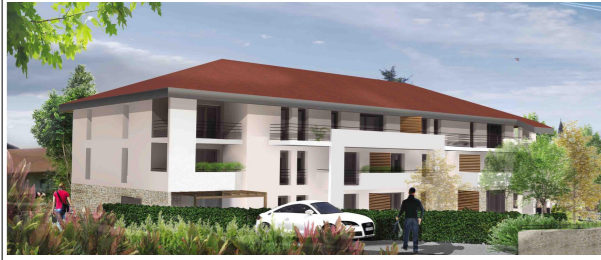
rue de l'Eglise 01630 Saint Jean de Gonville